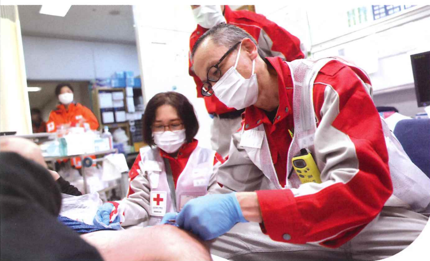
令和6年能登半島地震における救護活動の様子