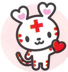
日本赤十字社公式キャラクター「ハートちゃん」

日本赤十字社は、災害救護活動などを行う民間の法人です。その活動は、国や地方自治体からの補助金ではなく、