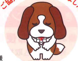
日本赤十字社北海道支部 マスコットキャラクター「アンリー」

※令和5年度の活用内訳は、決算が確定する令和6年6月頃にホームページ等で報告いたします。 (活動の運営管理とは) 赤十字はボランティアが中心となって活動していますが、事業が円滑に進むよう専任の職員がボランティアとの調整や救援物資・資材の調達、訓練や講習会などを初めとする事業の企画・立案・調整・報告などを行っています。運営管理費にはこれら職員の人件費を含め、社屋の維持管理費・諸税などが含まれています。